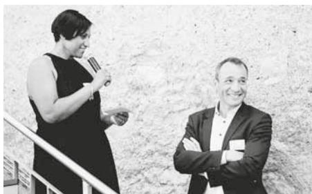
Impressionen des letzten Primavera-Apéros, welcher auf einem Weingut in Fläsch stattfand.

Das Ticket für den Autunno-Event kostet Fr. 189.00 pro Person (für Mitglieder Fr. 160.00) und beinhaltet einen Apéro riche sowie ein Give-away. Infos und Anmeldung unter www.networking-suedostschweiz.ch oder über die Telefonnummer 079 403 92 61.