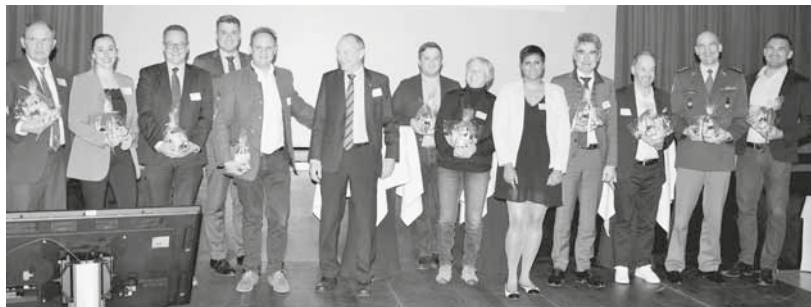
Abschlussbild der Mitwirkenden am 1. Autunno-Event 2021