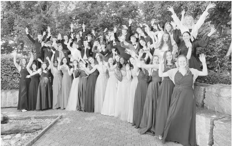
Abschlussklassen Schuljahr 2000/2021: 3. Real- und Sekundarklasse mit Klassenlehrpersonen