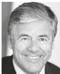
Josef Ackermann, ehemaliger CEO der Deutschen Bank