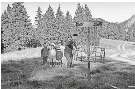
Disc-Golf-Parcours auf Pardiell

Disc-Golf – noch nie gehört, werden sich einige LeserInnen wohl denken. Dies aus gutem Grund! Die Sportart ist zwar in der Schweiz noch nicht so populär wie in anderen europäischen Ländern, doch wird schon seit rund 25 Jahren in mehr als 20 Vereinen in der Schweiz Disc-Golf gespielt. Der Schweizer Disc-Golf-Verband ist ebenfalls Mitglied bei Swiss Olympic sowie auch bei internationalen Partnerverbänden. Dies ermöglicht auch den weltweiten Anschluss an Turniere. Die ersten Europameisterschaften in der Schweiz wurden bereits 1999 ausgetragen.