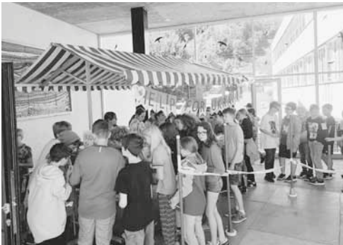
Pausenkiosk der 5./6. Primarklassen

Viele Schulkinder, welchen die Morgenpause auf diese Art «versüsst» wurde, meinten zum Schluss der Hilfsaktion: «Schade, dass der Pausenkiosk schon zu Ende ist.»