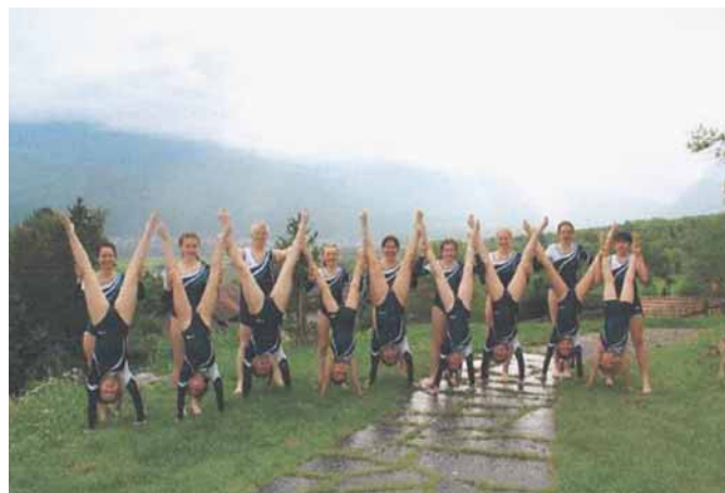
Die an der World Gymnaestrada 2023 teilnehmenden Geräteturner/innen