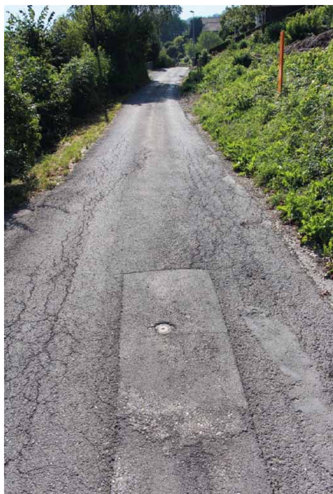
Bidemsstrasse: starke Belagsschäden, vereinzelte Setzungen

Die diesbezügliche Antragsstellung für die Projekt- und Kreditgenehmigung erfolgt an der Bürgerversammlung vom 24. März 2023.