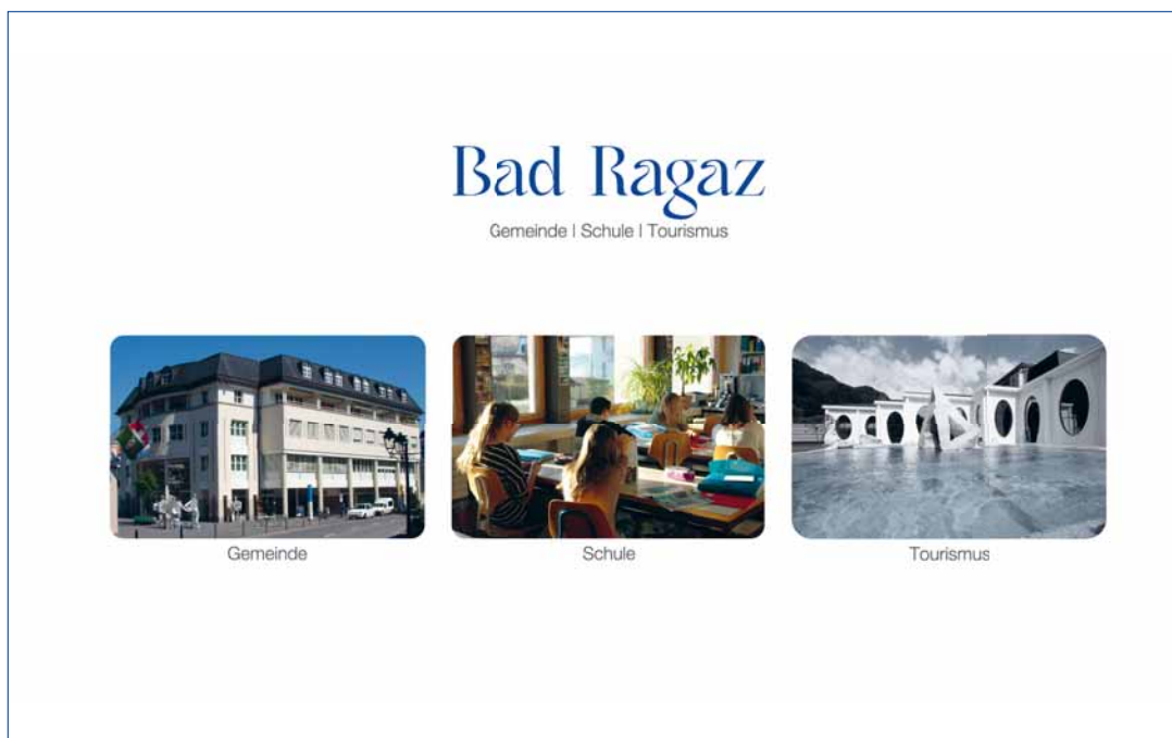
Webseite der Gemeinde