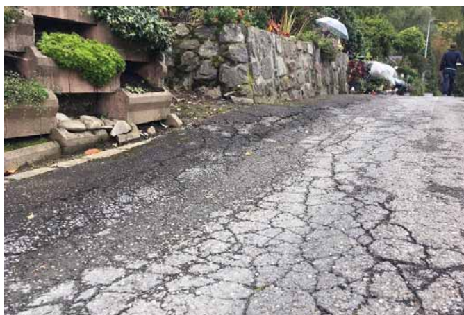
Bidemsstrasse: Setzungen Fundationsschicht, Spurrinnen, starke Belagsschäden

Die Bidemsstrasse ist auf dem Strassenabschnitt zwischen dem Knoten Bidemsweg bis Knoten Majarinaweg in einem schlechten baulichen Zustand. Im Rahmen von Abklärungen wurde festgestellt, dass die Fundationsschicht nach den heutigen Dimensionierungsgrundsätzen der entsprechenden Normgebungen ausgebildet ist. Im Laufe der Zeit sind zahlreiche Spurrinnen und Rissbildungen in der Fahrbahn entstanden. Die Bidemsstrasse muss deshalb auf diesem Teilstück kurz- bis mittelfristig neu gebaut werden. Gemäss Strassenplan der Gemeinde Bad Ragaz ist die Bidemsstrasse als Gemeindestrasse 2. Klasse eingeteilt. Nach dem Teilplan Fuss-, Wander- und Radwegplan, Mountainbikerouten der Gemeinde verläuft auf der Bidemsstrasse auch noch ein Fussweg.