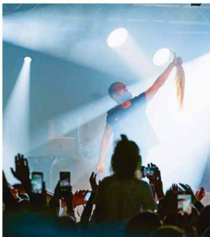
Headliner Bligg und seine Band begeistern das Publikum.

Am Abend hatten wir dann einen sehr gut gefüllten Hangar und die Stimmung war fantastisch. Alle Bands haben überzeugt und das Publikum begeistert. Vielen