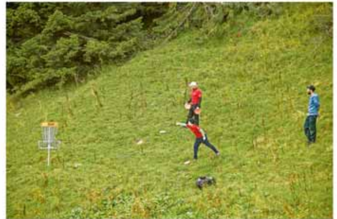
Disc Golf Parcours