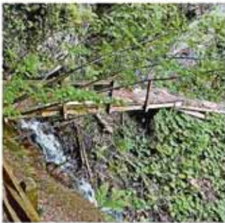
Die Brücke wurde durch ein Steinschlagereignis und umgestürzte Bäume beschädigt.

Alpweg hoch Richtung Vilterser Äpli Untersäss (Gemeinde Vilters-Wangs) oder talwärts Richtung Narrenberg. Die Brücke über die Saar im Saartobel wurde durch ein Steinschlagereignis und umgestürzte Bäume beschädigt. Das Gelände wurde teilweise abgerissen und auch am Gehweg wurden einige Bretter beschädigt. Die Mitarbeitenden des Werkhofes haben die beschädigten Holzteile zwischenzeitlich ersetzt und damit die Brücke rechtzeitig zum Beginn der Wandersaison wieder begehbar gemacht. Somit steht einem angenehmen Wanderspass nichts mehr im Wege.