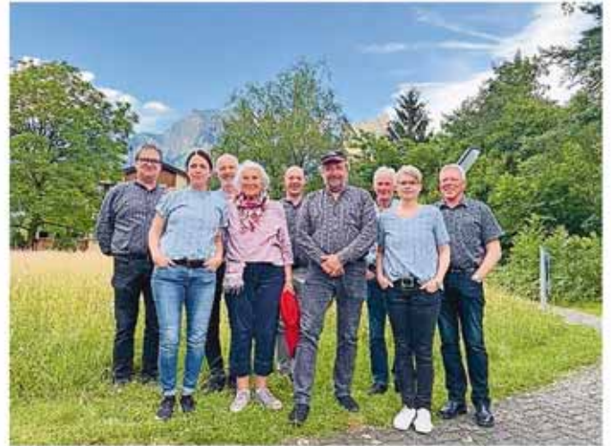
Monteluna Brassband und Rös Untersander