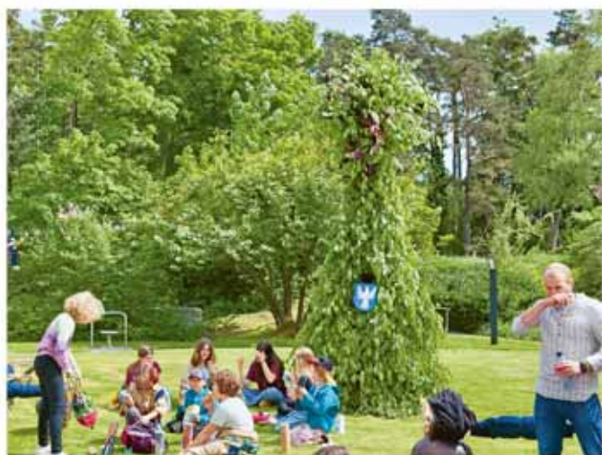
Besuch des «Maibärs» im Altersheim Allmend

Zur grossen Freude der Bewohnerinnen und Bewohner besuchte der «Maibär» auch dieses Jahr traditions-gemäss das Altersheim. Mit lautem Getöse und dem Klang von Büchsen wurde die Vertreibung der Winter-geister in den Strassen und Gassen zelebriert.