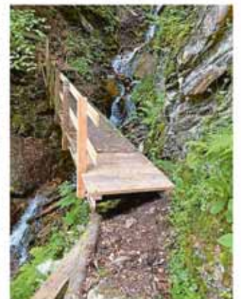
Die Instandstellungsarbeiten wurden durch einen Mitarbeitenden des Werkhofes ausgeführt.