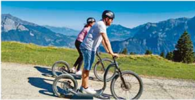
Fahrt mit Alpine Scooter

Wanderwegen in verschiedenen Schwierigkeitsgraden eignet sich der Pizol ideal für Gruppenausflüge. Die atemberaubenden Panoramaaussichten, die faszinierende Natur und die gemütlichen Berghütten und Restaurants sorgen für ein unvergessliches Erlebnis. Für zusätzlichen Spass bieten wir abwechslungsreiche Abfahrten mit dem Alpine Scooter, spannende Stunden auf unserem Disc Golf Parcours, einzigartige Apéros und vieles mehr!