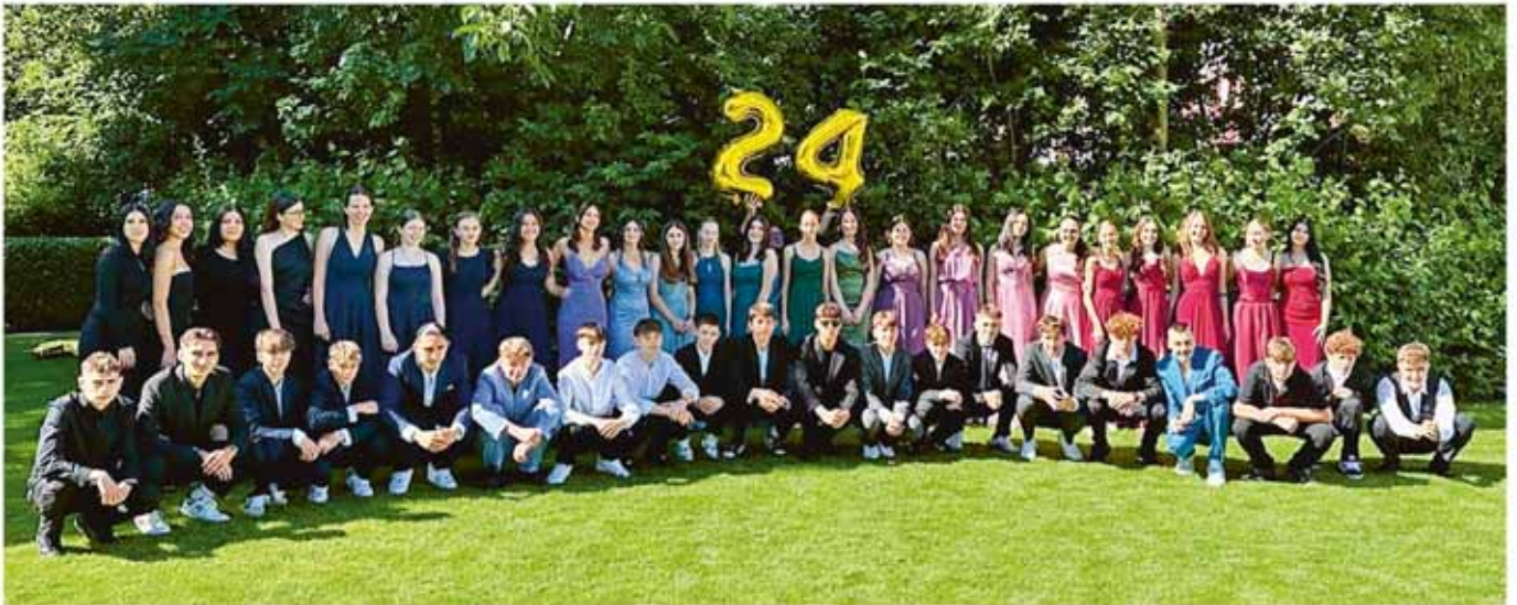
Abschlussklassen Schuljahr 2023/24: 3. Real- und Sekundarklasse

Am 5. Juli 2024 verabschiedeten wir unsere Abschlussklassen, die ihre Volksschulzeit hinter sich liessen. Oder anders gesagt, die Abschlussklassen verabschiedeten sich selber in grossartiger und würdiger Form von den jüngeren Schülerinnen und Schülern sowie den Lehrpersonen.