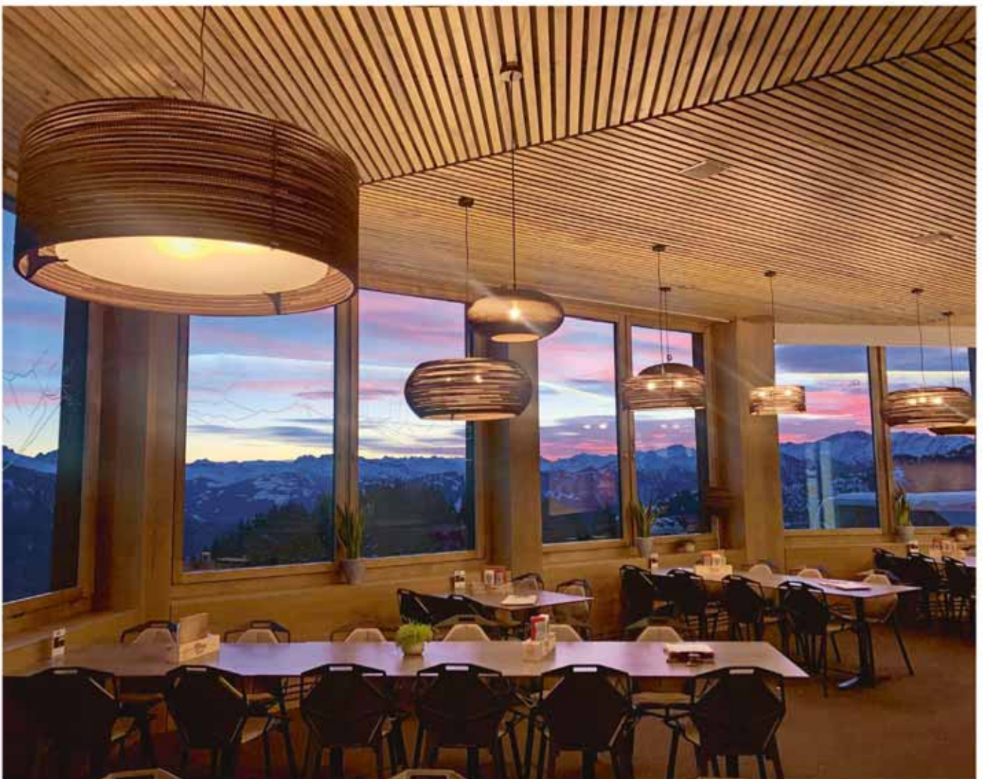
Das Panoramarestaurant Edelweiss bietet eine traumhafte Aussicht ins Rheintal.