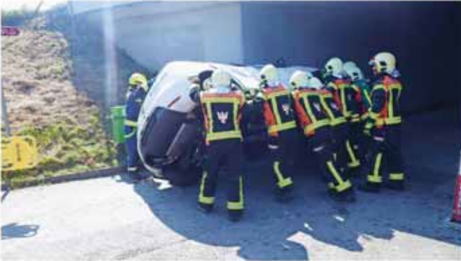
An mehreren Standorten in Bad Ragaz wurden Autounfälle simuliert.