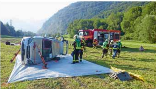
Trotz heissem Hochsommerwetter waren alle Kursteilnehmenden sehr motiviert und zeigten vollen Einsatz.