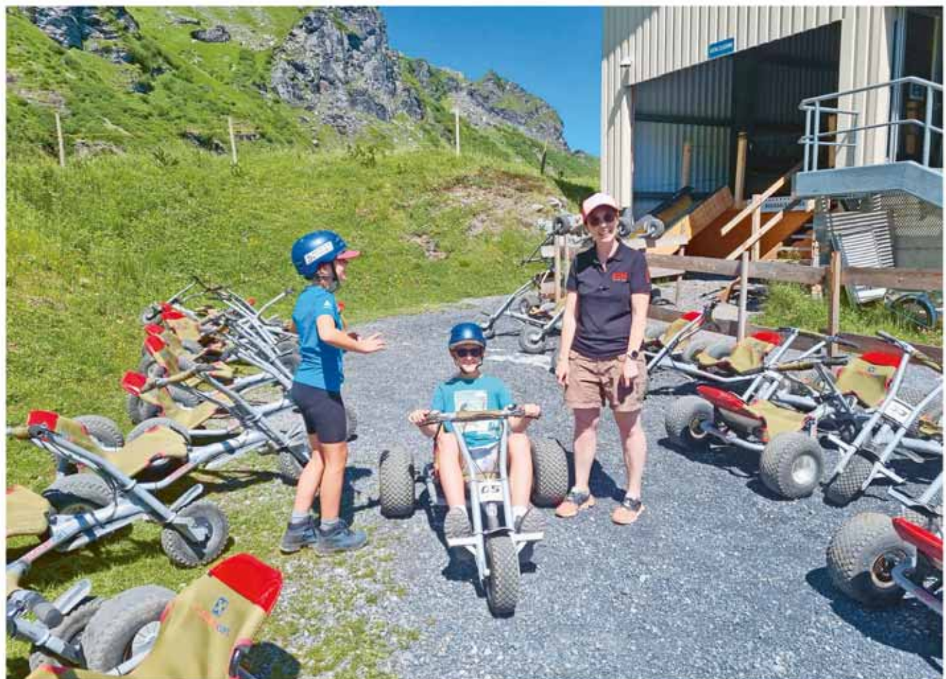
Auch die Mountaincarts ermöglichen eine spannende und abwechslungsreiche Fahrt durch die eindrucksvolle Berglandschaft am Pizol.