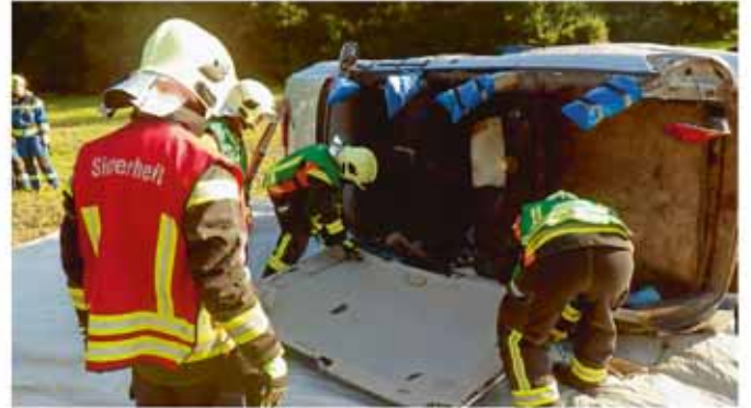
Mit Schneidwerkzeug nahmen die Kursteilnehmenden die Autos auseinander.