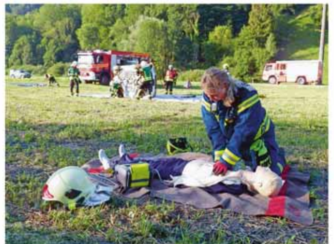
...anschliessend wurde Erste Hilfe geleistet.