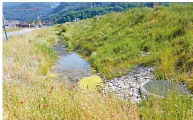
Projekt Flamsbach, Gemeinde Bad Ragaz (Blick ab Unterrainstrasse Richtung Süden)

Die Mitwirkung zum Projekt fand für die Bevölkerung vom 17.Januar 2022 bis 17.Februar 2022 statt. Die Gemeinde gab am 17.Februar 2022 eine Stellungnahme zum Projekt ab. Von der Mitwirkung wurde reger Gebrauch gemacht. In der Folge prüfte der Kanton die Mitwirkungseingaben. Im Projekt wurden zuletzt insbesondere noch Abstimmungen im Zusammenhang mit dem kommunalen Velokonzept vorgenommen und die Querungsstellen bei den Knoten optimiert. Im vorliegenden Bauprojekt sind die Eingaben des Gemeinderates eingeflossen. Das Bauprojekt sowie die zeitnahe Umsetzung werden durch die Gemeinde Bad Ragaz sehr begrüsst.