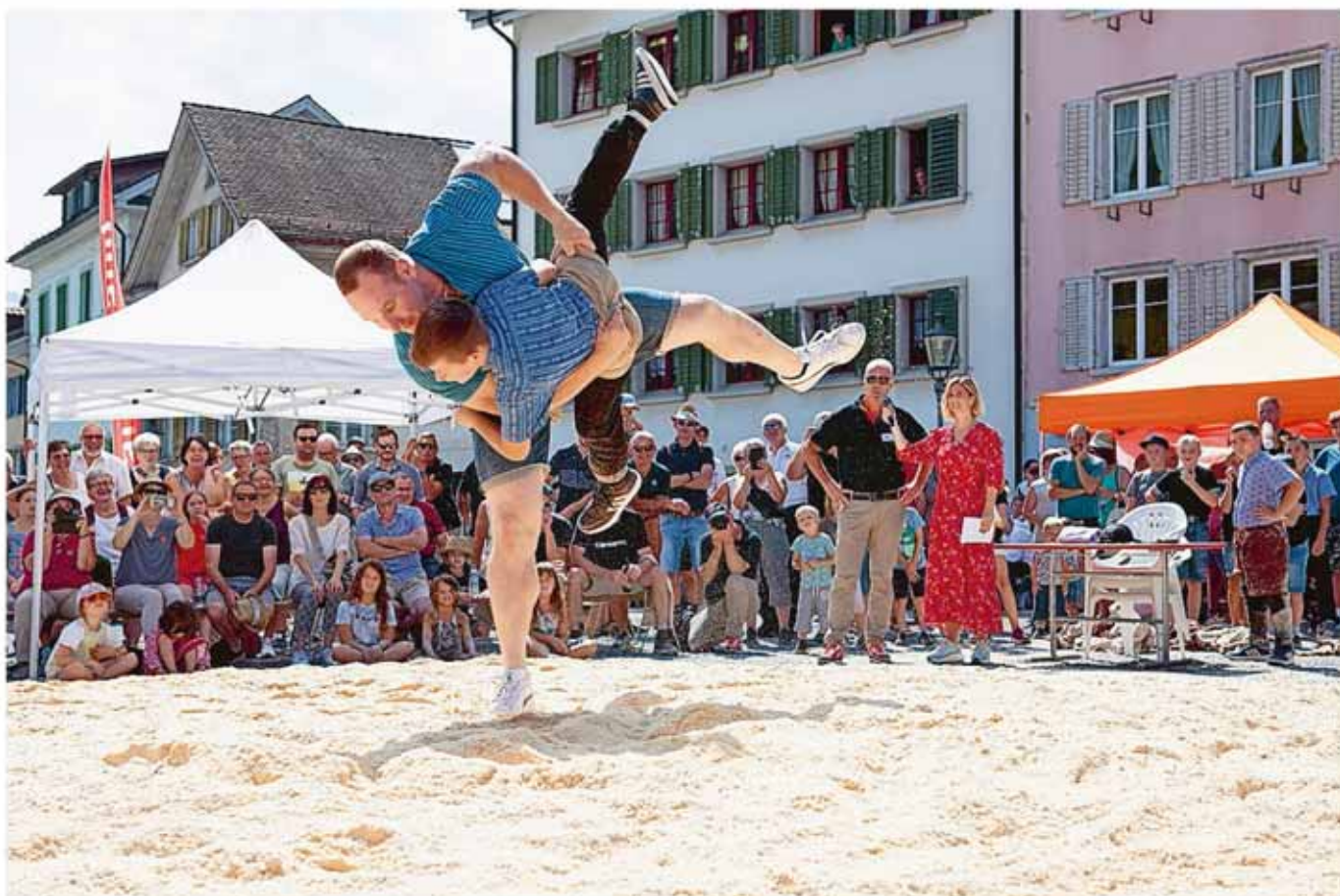
Schwingerkönig Joel Wicki wirbelt Jungschwinger Devin Pianta durch die Luft – dieser wehrt sich aber wacker, Wickis Feedback: «Der chunt guet.»