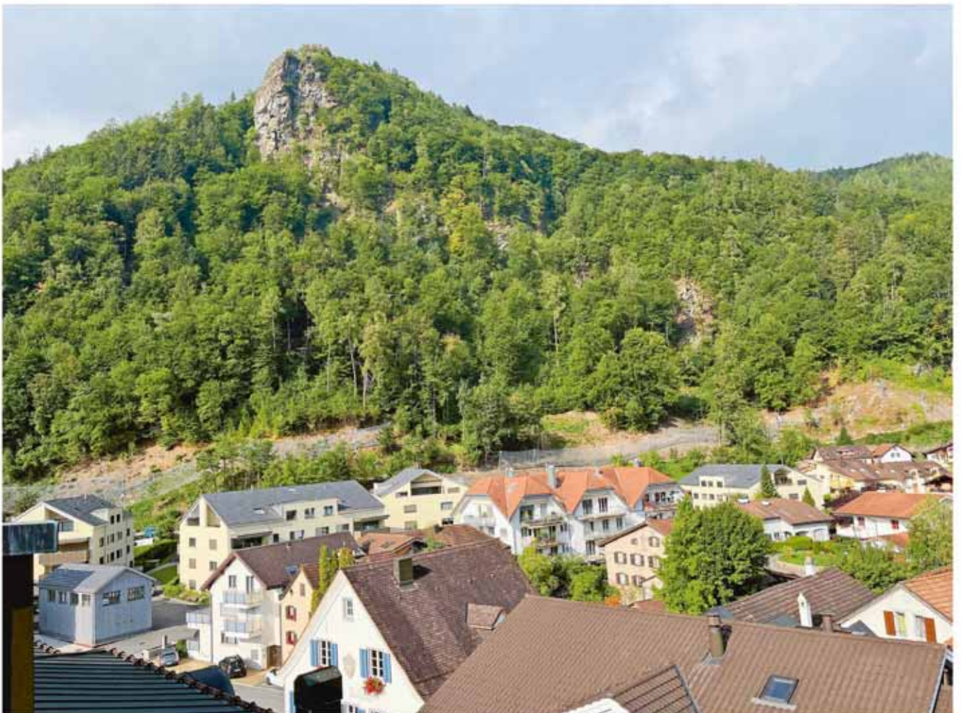
Blick auf den Guschakopf

davon liegenden Felswänden liess die Gemeinde Bad Ragaz ein Projekt ausarbeiten. Am 28. April 2020 wurde das Ingenieurbüro Bänziger Partner AG (Federführung), Oberriet, mit dem Auftrag für die bauliche Realisierung und Umsetzung der Massnahmen beauftragt. Das Projekt sah Massnahmen an den Felswänden sowie den Bau von Schutznetzen oberhalb der Valenser-, Felsenkeller- und Weiligstrasse vor. Die Kosten für diese Massnahmen beliefen sich gemäss Kostenvoranschlag vom Februar 2020 auf 1.64 Mio. Franken. Damit der Bund und der Kanton das Projekt mit namhaften Beträgen (ca. 75%) subventionieren, mussten die Restkosten