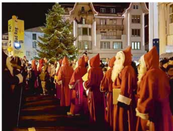
Einzug der Samichläuse und Schmutzli ins Dorf Bad Ragaz

Der Samichlaus wird wiederum am 6. und 7. Dezember viele Familien mit ihren Kindern sowie Senior/innen besuchen. Traditionell am 6. Dezember zieht der Bischof mit den Samichläusen und Schmutzli um 18.00 Uhr vom Föhrenwäldli entlang der Taminapromenade durch das Dorf zum Dorfbad. Klein und Gross sind willkommen, das einmalige Ambiente zu erleben und sich die sicher wiederum eindrückliche Rede des Bischofs anzuhören und auf die festliche Adventszeit in märchenhaftem Umfeld einzustimmen. Der Bischof und seine Samichläuse bringen in ihren Laternen das Licht ins Dorf, in die Häuser und in die Herzen aller Besucher. Im Anschluss an die Rede besuchen der Samichlaus und Schmutzli die angemeldeten Kinder.