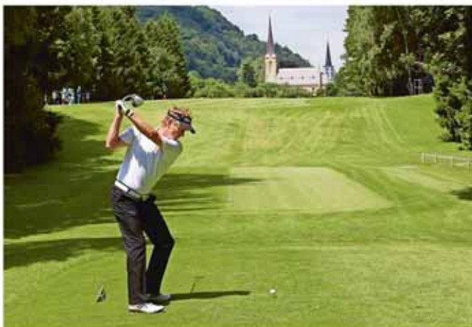
Blick auf den Golfplatz

Die Grand Resort Bad Ragaz AG beabsichtigt, nicht nur die Greens zu sanieren, sondern auch einen künstlichen See bei Loch 12 (Nahbereich reformierte Kirche) neu zu erstellen und mit dem Abflusswasser der Tamina Therme zu speisen. Hinsichtlich der thermischen Nutzung des Abwassers der Tamina Therme verfügt die Gemeinde Bad Ragaz über eine Wasserrechtskonzession und gewässerschutzrechtliche Bewilligung des Baudepartementes des Kantons St. Gallen. Diese ist noch bis am 31. Dezember 2035 gültig. Gemäss dieser Konzession darf die Gemeinde die Restwärme des Badeabwassers der Tamina Therme zu Heizzwecken des Badewassers für das Freibad Giessenpark durch einen Plattenwärmetauscher nutzen. Bei einer direkten Speisung des im