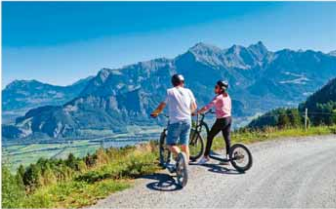
Fahrt auf den Alpine Scootern

Die Gäste profitieren am Vormittag von 50% Rabatt auf die Fahrten mit den Moutaincarts und Alpine Scootern. Das Angebot gilt während den Herbstferien täglich bis Sonntag, 20. Oktober 2024, für Fahrten von 09.00 bis 12.00 Uhr und ist nicht mit anderen Vergünstigungen kumulierbar. Ob Mountaincart oder Alpine Scooter – beide Fahrzeuge ermöglichen eine spannende und abwechslungsreiche Fahrt durch die eindrucksvolle Berglandschaft am Pizol.