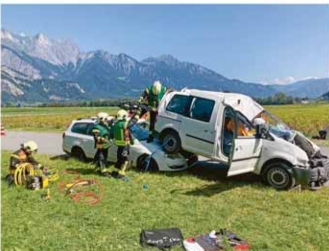
Die «Opfer» wurden aus den «verunfallten» Autos gerettet...