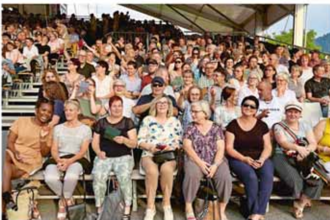
Mitarbeiteranlass Heidi-Musical, Walensee-Bühne

Am Freitag, 28. Juni 2024, und am Donnerstag, 4. Juli 2024, hatten die Mitarbeitenden des Altersheims Allmend die Gelegenheit, gemeinsam das bekannte Heidi-Musical zu besuchen. Bei strahlendem Wetter nahmen insgesamt 45 Mitarbeitende an diesem besonderen Anlass teil. Der Mitarbeiteranlass bot eine wunderbare Gelegenheit, den Mitarbeitenden für ihren täglichen grossen Einsatz und ihr Engagement zu danken. Die Atmosphäre war ausgezeichnet, das Essen köstlich und die musikalische Aufführung war schlichtweg grandios.