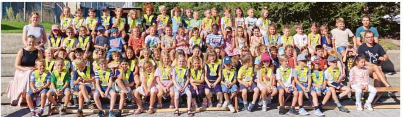
Die Erstklässler mit ihren Lehrpersonen am 12. August 2024

Wir wünschen sowohl unseren jüngsten Primarschulkindern als auch allen übrigen Schülerinnen und Schülern eine erfolgreiche, glückliche und schöne Schulzeit.