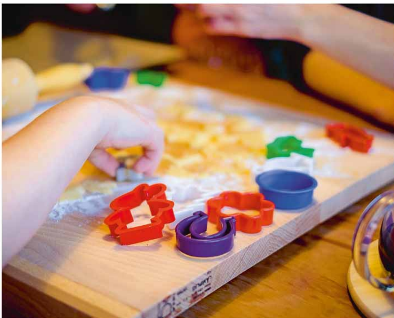
Kinder im Primarschulalter (1. Kindergarten bis 6. Schuljahr) sind herzlich eingeladen zum Backen und Basteln für den Advent.

Anmeldungen und Rückfragen gerne an Pfrn. Sabine Gäumann, Tel. 081 302 71 89, sabine.gaeumann@ref-badragaz.ch