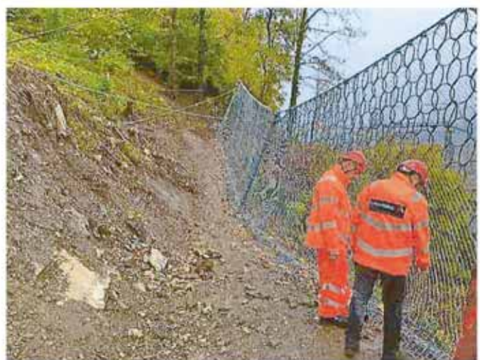
Abnahme der Netze durch Hersteller