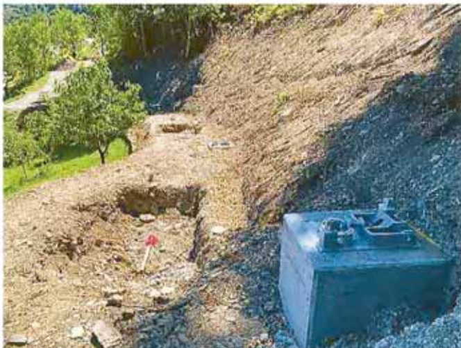
Fundamente für Netzstützen