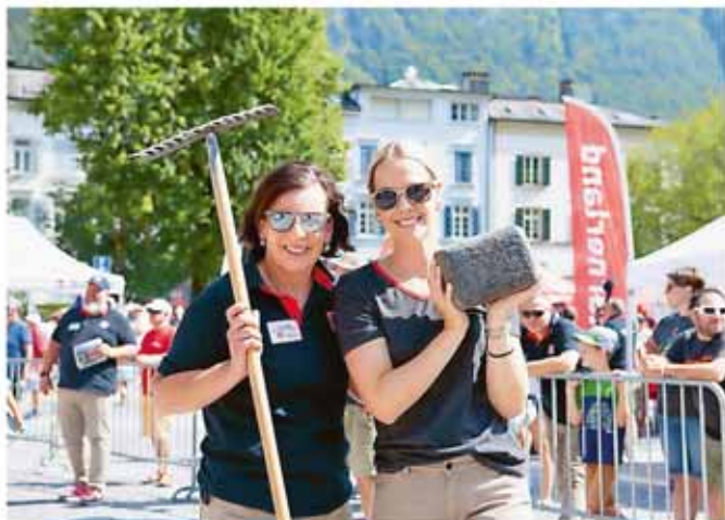
Die ESAF-Botschafterinnen Skilegende Vreni Schneider und Schlagersängerin Linda Fäh helfen beim Plausch-Steinstossen.

Der Besucherandrang war gross. Nun läuft der Countdown und das OK ESAF 2025 Glarnerland+ freut sich auf das grosse Fest mit Ihnen.